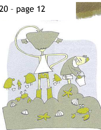
Y a trop de monde ici!